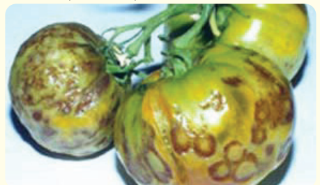
автор: из книги д. Хессайона "Все об овощах"

Распространяется как и мозаика. Меры борьбы такие же, как и с мозаикой, плюс уничтожение сильно пораженных растений. Далее*