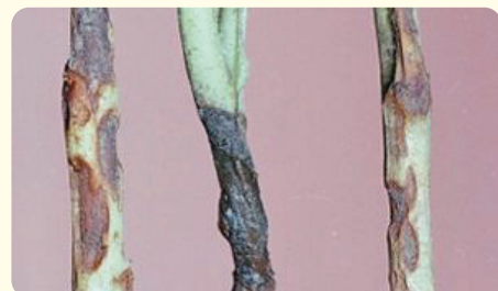
Возбудителями черной ножки являются различные почвенные грибы (полусaproфиты) из

Черная ножка – болезнь сеянцев помидоров, возникающая при загущении посевов, высокой влажности воздуха и почвы, при недостаточном проветривании. Прикорневая часть стебля чернеет, подсыхает, растение погибает или развивается с опозданием. В случае образования новых корней – выше место поражения.